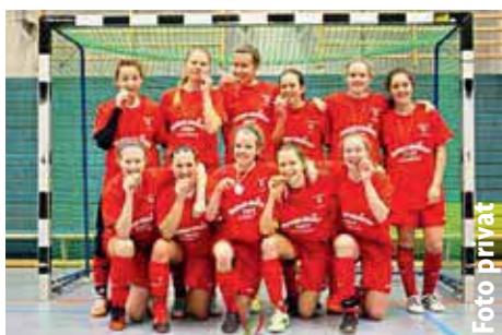
Futsal-Meister B-Mädchen Walddorfer SV

A m 04.02.2017 wurden die HFV-Futsalmeisterinnen der B-Mädchen 2016/2017 in der Sporthalle in Barsbüttel aus sechs Finalisten ermittelt. Es nahmen insgesamt 24 Mannschaften an dieser Futsal-Meisterschaft teil und nach drei Run-