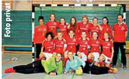
Futsal-Meister C-Mädchen Eimsbütteler TV

A m Samstag, dem 04.02.2017, stand in der Halle in Barsbüttel der Hamburger-Futsalmeister der C-Mädchen nach 3 Stunden und 15 Spielen fest. Die Mädchen vom Eimsbütteler TV konnten sich diesen Titel erspielen. Hamburger-Futsal-Vizemeister der C-Mädchen wurden die Mädchen vom SC Eilbek und konnten sich somit, wie der Eimsbütteler TV, für den NFV-Futsal-Cup der C-Mädchen am 04.03.2017 in Salzhäusen qualifizieren. Wir drücken beiden Mannschaften die Daumen, dass sie sich auch dort durchsetzen