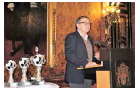
Ex-St. Pauli-Trainer Ewald Lienen

Veranstalter des jährlichen Turniers ist der schwul-lesbische Sportverein Startschuss SLSV Hamburg e.V. Dort sind etwa 750 Mitglieder in mehr als 15 Sportarten aktiv.