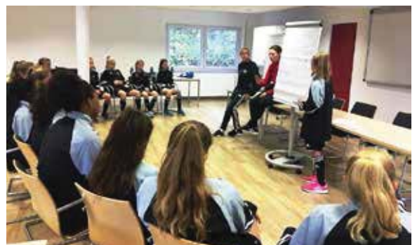
Besprechung in Barsinghausen