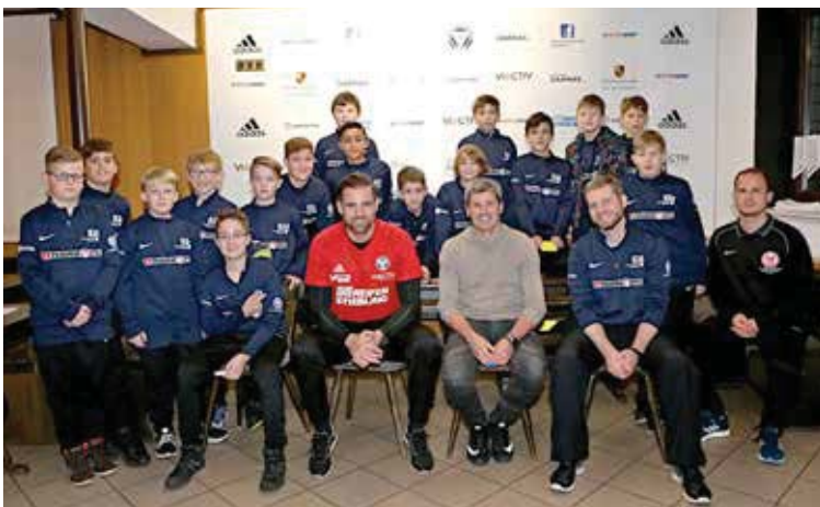
Merk und Metzelder bei Schiedsrichter-camp für Hämophile Kinder