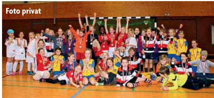
Die F-Mädchen hatten Spaß

Und auch wir können bestätigen, dass sich alle daran gehalten haben. Die Mädchen hatten offensichtlich Spaß am Fußball spielen. Auch wenn