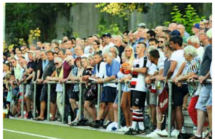
1008 Zuschauer sahen die Oberliga-Saisonöffnung