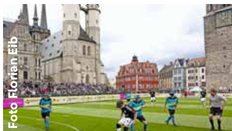
Wiederholung des Blindenfußball-Finales von 2017

Platzierungsspiele am Final-Spieltag (31. August 2019) in Saarbrücken: Spiel um Platz fünf: MTV Stuttgart SG – FC Viktoria Berlin/PSV Köln Spiel um Platz drei: Borussia Dortmund – FC Schalke 04 Spiel um Platz eins: FC St. Pauli – Sportfreunde BG Blista Marburg