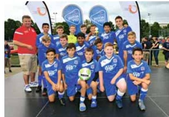
4. Platz für AC Schwaben Chicago bei der Jugendfußball-Saisoneneröffnung

Betreuer und Trainer aus Chicago betonten vor ihrer Abreise, wie gelungen die Reise nach Hamburg war. Wir freuen uns, unsere Freunde aus Chicago schon im Oktober wieder zu sehen. Mein Dank gilt allen Menschen im HFV, die mitgeholfen haben und z. T. ihren Urlaub