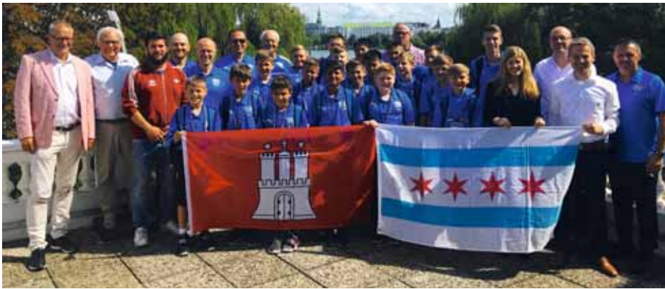
Besuch beim Generalkonsulat der Vereinigten Staaten von Amerika