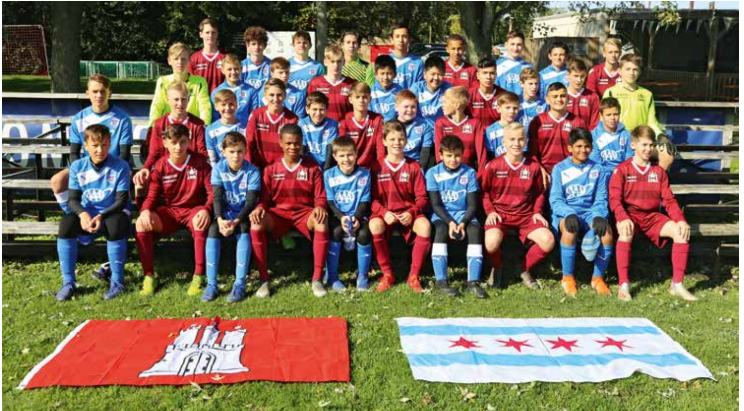
Friendship Hamburg – Chicago