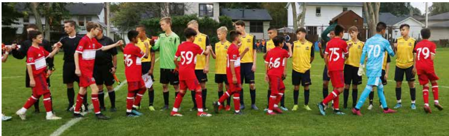
Handshakes vor dem Spiel gegen Chicago Fire