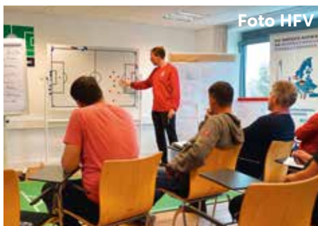
Ab 1. November anmelden für Aus- und Fortbildungslehrgänge des HFV

Ab dem 1. November 2019 sind Anmeldungen möglich Anmeldungen können direkt im DFBnet oder auf hfv.de unter Aus- und Fortbildung > Anmeldung TrainerInnen Aus- und Fortbildung vorgenommen werden.