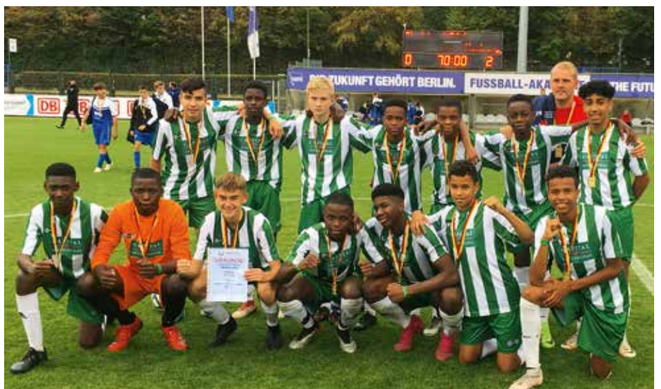
2019 Berlin WKIII Jungen Bundessieger: STS Alter Teichweg

Noch besser lief es in der Wettkampfklasse III der Jungen, in der