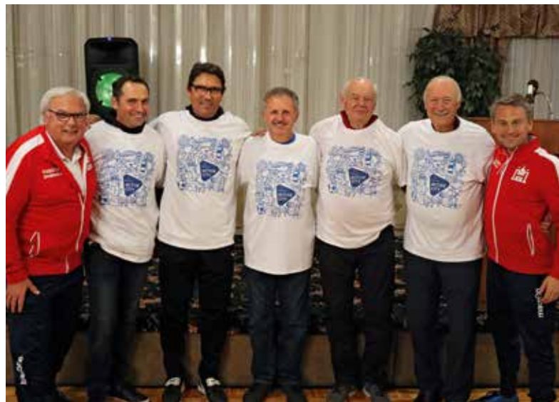
Active City beim Treffen der HFV-Delegation mit dem AC Schwaben Chicago