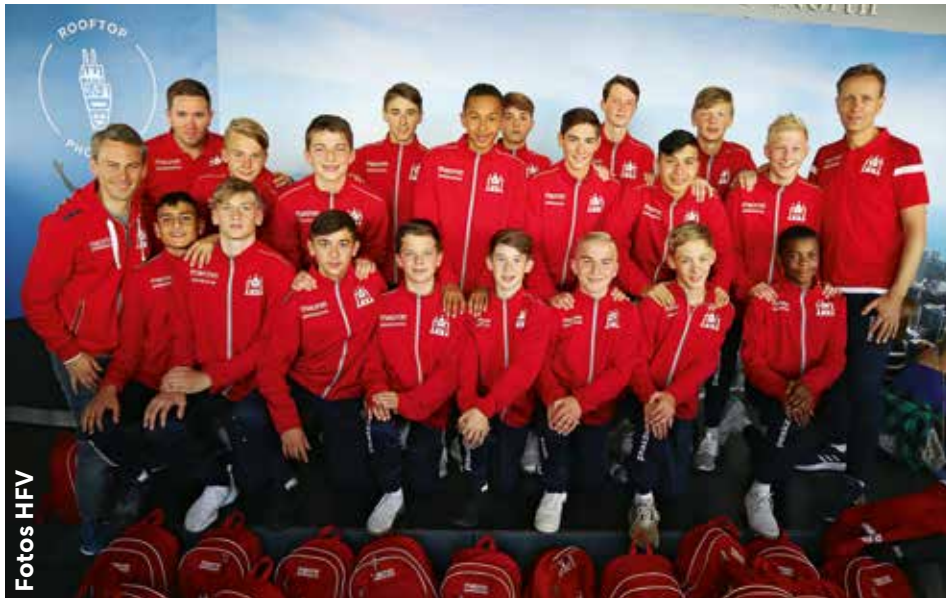
Die HFV 2006er-Junioren in Chicago