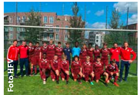
HFV 2008er-Junioren gegen Berlin