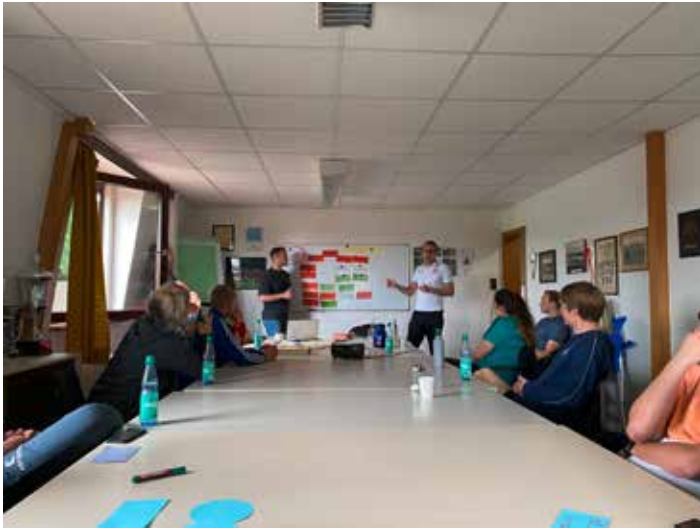
Die Experten gaben interessante Einblicke, zum Beispiel in Nachwuchsarbeit oder Sportpsychologie