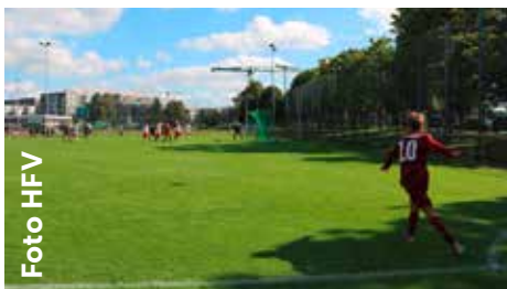
Endlich wieder Auswahlteams aktiv bei HFV