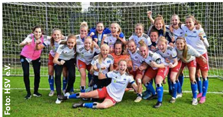
Jubel der HSV-Frauen nach dem Einzug in die dritte DFB-Pokal-Runde.

Naward, die ihrem Team mit zwei stark parierten Elfmern den Sieg und den Einzug in die dritte Runde des DFB-Pokals sicherte.