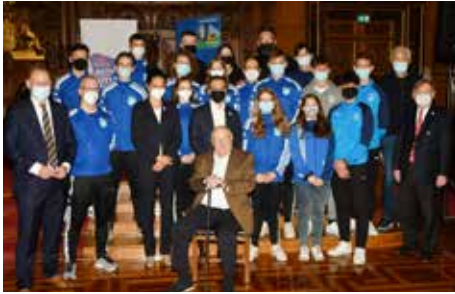
Gewinnervereine mit Ehrengästen

herausfordernden Corona-Zeit Herausragendes geleistet. Ich freue mich daher sehr, dass ich die Vereine heute gemeinsam mit Philipp Lahm und Celia Šašić und natürlich Uwe Seeler im Rathaus ehren konnte.“