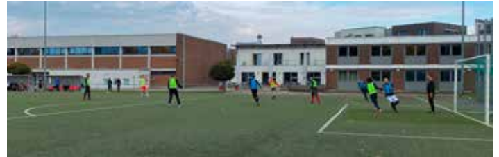
Lehrprobe beim HFV