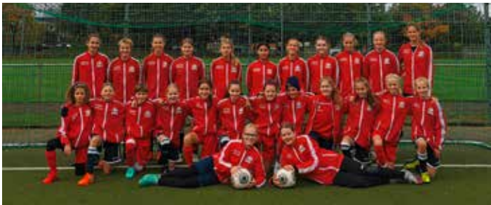
Die U14-Mädchen des HFV

stand auch ein fußballspezifisches Dehnen, Spaß und Gesellschaftsspiele auf dem Programm. Nicht nur die Sonne sorgte für gute Stimmung, sondern vor allem die Spielerinnen und Trainerinnen haben ihrer schönen Energie und Freude freien Lauf gelassen und so Lust auf mehr hervorgerufen.