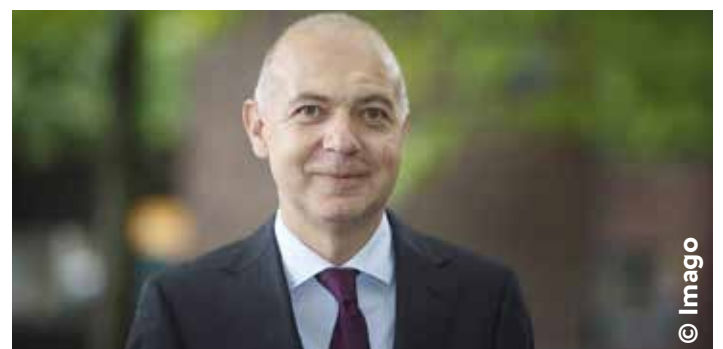
Kandidat der Landes- und Regionalverbandspräsidenten im DFB: Bernd Neuendorf